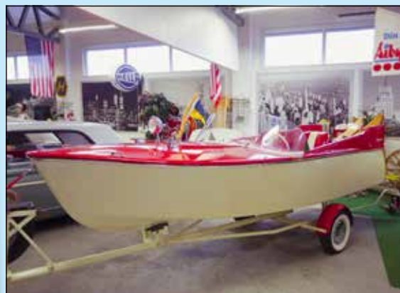
Pickupen ska få dragkrok monterad för att kunna dra den här Lillsnabben. Båten med fenor tillverkades i Sverige 1958.