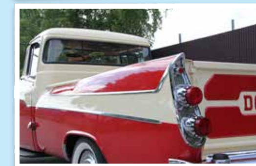
Fenor på en pickup var något helt nytt som Dodge var först med. Bakljuden påminner en hel del om de på personbilen från samma år.