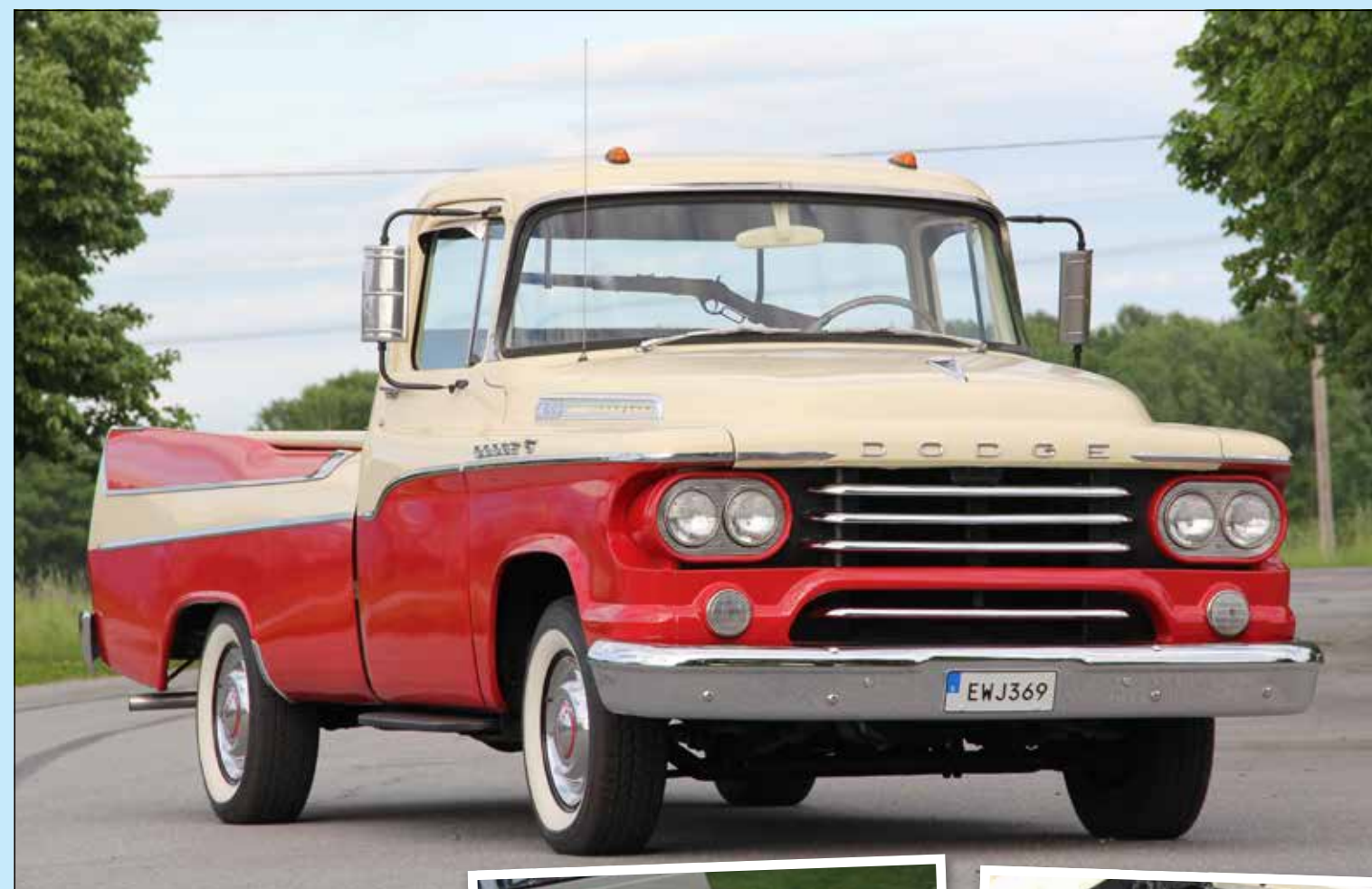
Grillen har en rätt enkel design men passar bra in i övrig formgivning.

Det är lite svårt att få fram exakt hur många Sweptside som tillverkades men