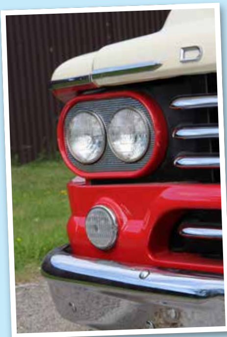
Dubbla strålkastare kom till årsmodell 1958.