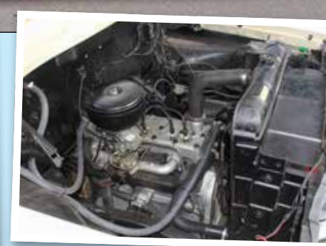
Det gick att få både sexa och V-åtta i den här modellen. Lars exemplar hade en rak sidventils sexa på 230 cui och 120 hk och den behölls.