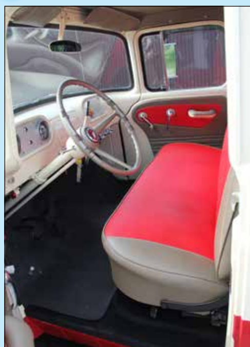
Inredningen var helt fel och en hel del energi fick läggas ner för att få till en som ligger nära originalutförandet.

Pickuper hade tidigare varit rena arbetsfordon men från mitten av 50-talet kom en ny trend i USA där man började se lite mera till utseendet och bekvämligheten även när det gällde pickuperna. Chevrolet var en av de tidigaste ute med sin Cameo-modell vilken kom till årsmodell 1955. Den hade påkostad design och gick dessutom att få med V-åtta på 265 cui, vilken var helt ny till den årsmodellen.